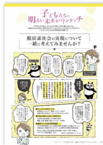
Hotpal 6月号 健康かぞくのまち 特集ページ